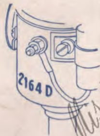
Marquage des Allumeurs