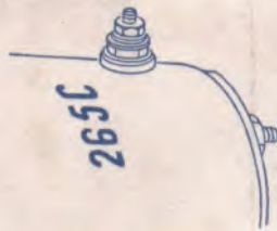
Marquage des Dynamos et Démarreurs

Par conséquent, c'est sous ces nouvelles références que ces pièces doivent être recherchées tant dans notre catalogue que dans notre tarif.